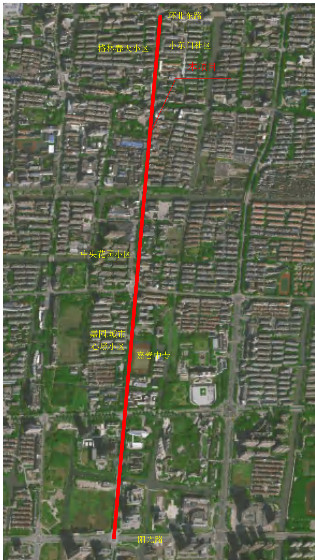
附图二 项目区域位置图